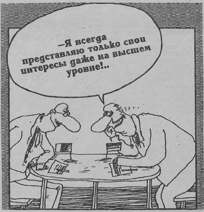
Рисунок Вячеслава ШИЛОВА