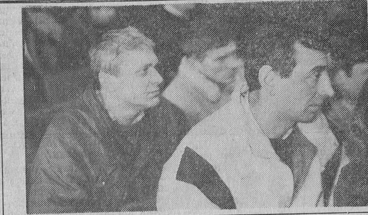
В преддверии знаменательной даты — 50-летия Победы в Великой Отечественной войне — во многих учреждениях, школах проходят встречи ветеранов с молодежью, на которых звучат рассказы о славном боевом прошлом сланцевчан. Проходили такие встречи и в объединении «Ленинградсланец». Ветераны-шахтеры поведали младшему поколению о том, как сражались горняки во время войны.