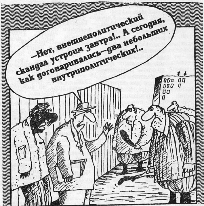
Рисунок Вячеслава ШИЛОВА