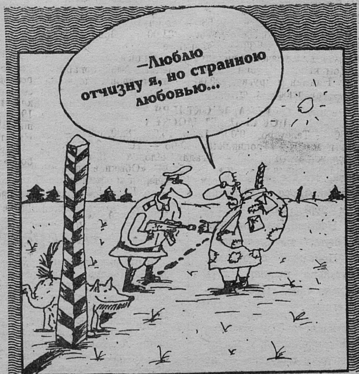
Рисунок Вячеслава ШИЛОВА