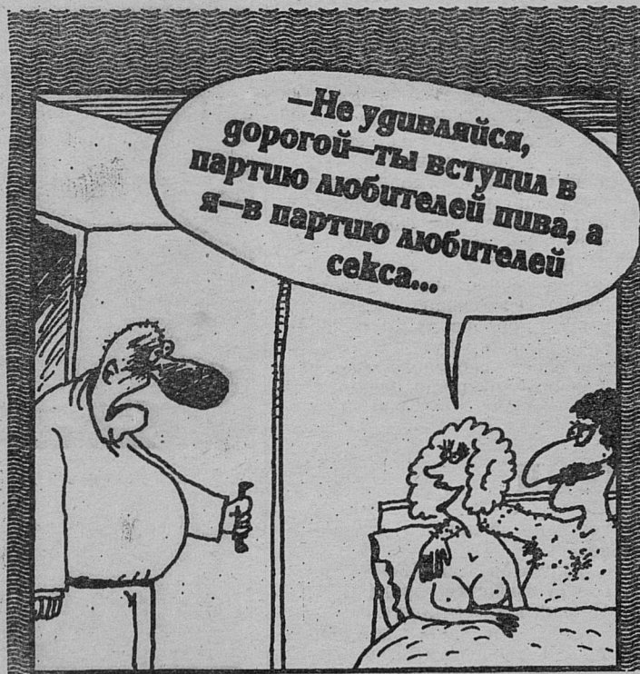
У Л Ы Б К А