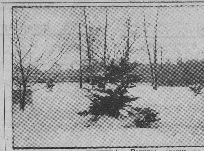
Родилась елочка, но не в лесу.

18.50 Футбольное обозрение. 19.30 КВН-ассорти. 20.05 Герои Дюма в приключенческой комедии «Четыре мушкетера». 22.00 Воскресенье. 23.00 Детективное агентство «Лунный свет». 0.05 Любовь с первого взгляда. 0.40 Все звезды. 1.10 «Три ненастных дня», телефильм. КАНАЛ «РОССИЯ» 8.00, 14.00, 20.00, 23.00 Вести. 8.25 Что день грядущий... 8.30 Теремок. 8.45 Первый дубль. 9.00 Ретро-шлягер. А. Пахмутова. 9.30 Хроно. 10.00 Доброе утро, Европа. 10.30 Аты-баты... 11.00 Вести в одиннадцать. 11.15 Русское лото. 11.55 Сигнальный экземпляр. 12.05 Амика веритас. 12.35 Футбол без границ. 13.15 Театр моей памяти. Программа В. Смехова. 13.45 Горячая десятка.