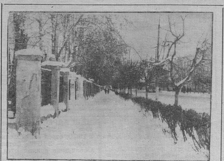
На улице Маяковского.