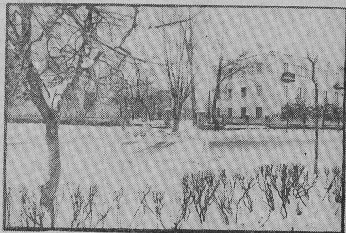
Штрихи уходящей зимы. Фотоэтюды А. ЗИНОВЬЕВА.