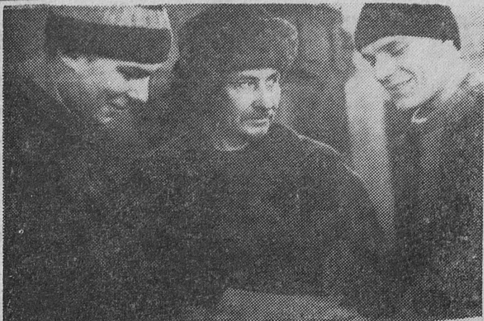
Одиннадцатый участок АО «Электромонтажсервис». Работает здесь в основном молодежь, и занимаются ребята изготовлением электромонтажных конструкций для Киришского нефтеперерабатывающего завода.

Большинство детских площадок города оборудованы качелями и каруселями, сделанными электрослесарями участка. Дворники ЖЭКов города пользуются лопатами для очистки улиц от снега, изготовленными руками электрослесарей. По выражению руководства участка, они могут сделать все, были бы деньги и заявка. Как и на других