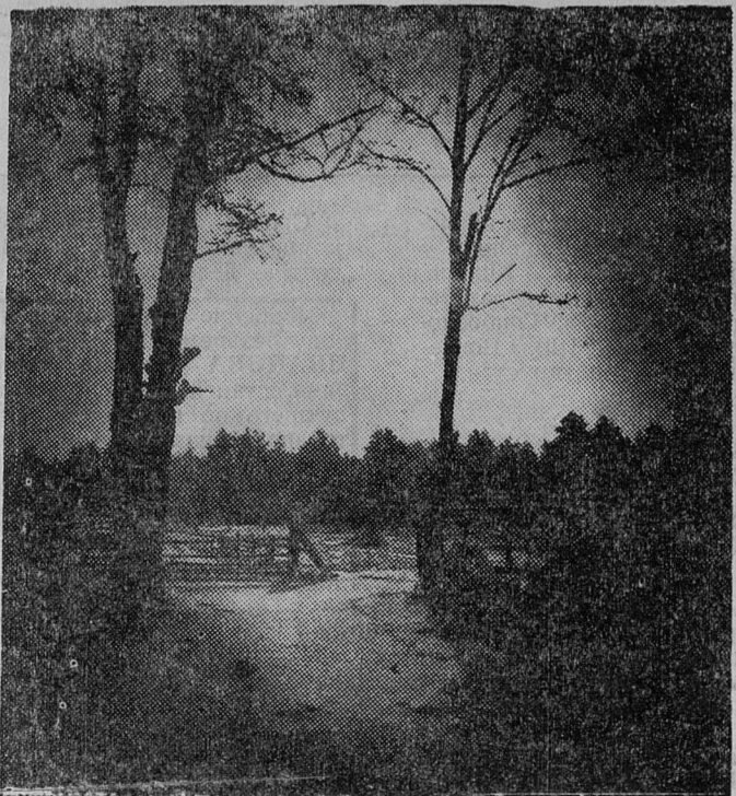
Таня ВОЛГОВА. «Ворота для солнышка».