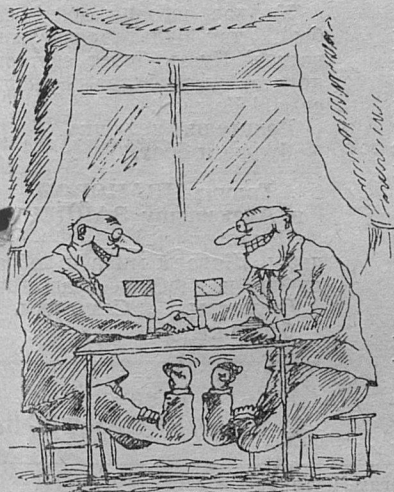
Рис. И. Кийко