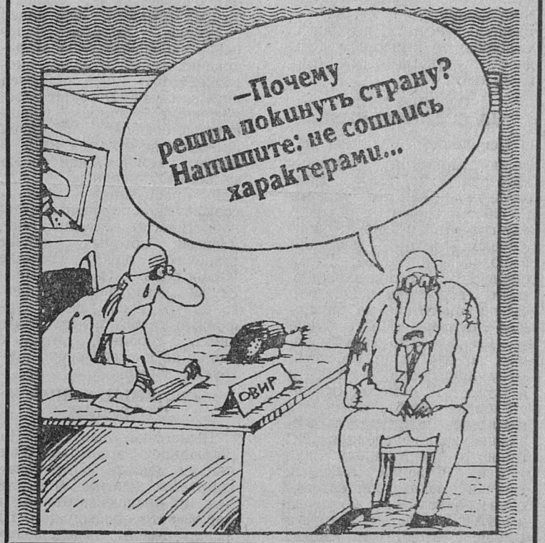
Рис. В. ШИЛОВА.