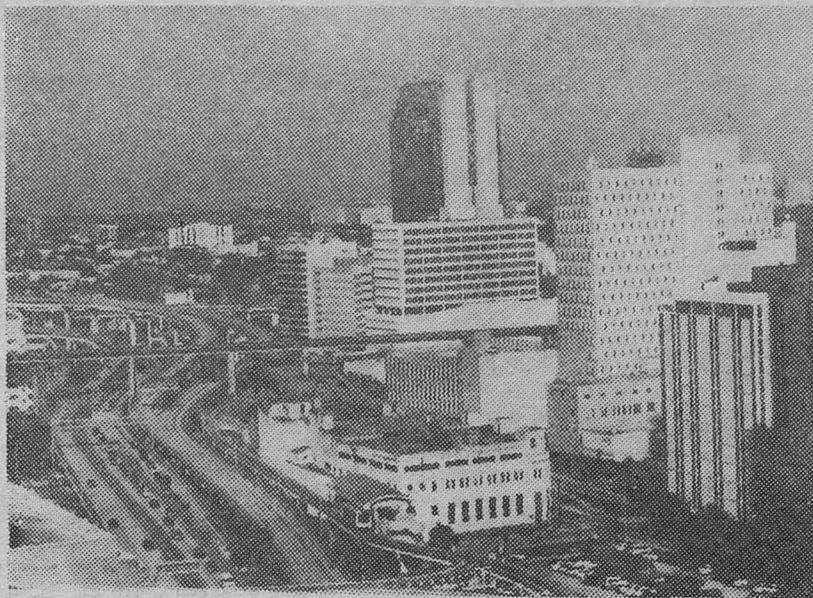
(Начало в № 80).

Конечно, жаль, что за две недели деловой поездки в Соединенные Штаты не удалось увидеть многого. Не побывали мы в знаменитом Диснейленде и в американском Санкт-Петербурге, хотя были вроде бы не так уж и далеко. Не поднялись на самое высокое здание в мире, что находится в Чикаго. Даже в настоящий большой супермаркет не удалось заглянуть. Но все-таки впечатлений осталось много. Самыми удивительными оказывались порой такие детали, которые для американцев давно уже стали привычными.