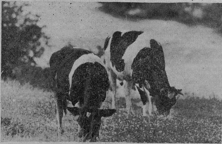
ХОРОШИЕ НЫНЧЕ КЛЕВЕРЫ!