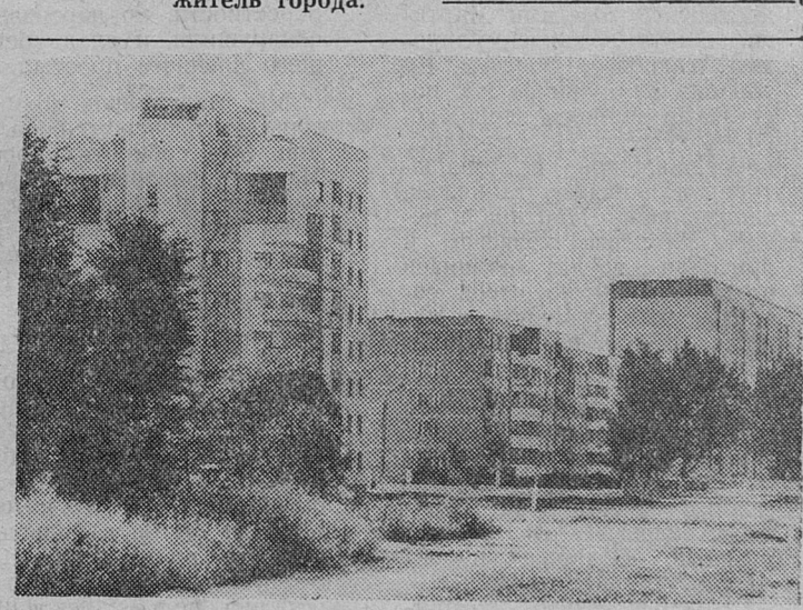
У новостроек.