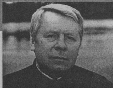
ми" по своевременной выплате пенсий...

Знать и держать все время под рукой все прогнозы по заболеваниям, все рекомендации и запросы специалистов по стабилизации ситуации и в здравоохранении, и в системе образования, и в системе социального обеспечения. Вот что в первую очередь должен делать руководитель, сказавший миллиону семистам тысячам жителей области — я готов взять на себя ответственность за то, как вы будете жить.