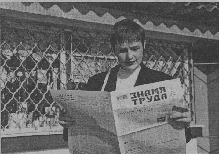
А вам интересна наша газета?

– На городских маршрутах установлен единый тариф, который не зависит от расстояния поездки (согласно правилам перевозок пассажиров и багажа автомобильным транспортом в Российской Федерации).