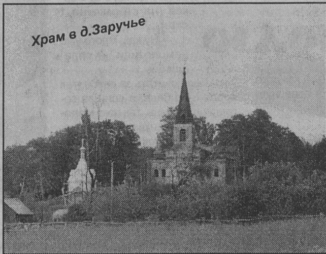
Храм в д. Заручье

Иконы отчины были такие: в Выскатке — Казанской Божьей Матери, перенесенная из Сижно с Крестным ходом 27.06.1875 года; Тихвинской Божьей Матери с ризой 10 фунтов серебра, список с Чудотворной; Сицилийской Божьей Матери из Александро-Невской Лавры (ранее находилась в Дивногорском Успенском монастыре); в старом храме Курешей, близ