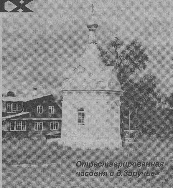
Отреставрированная часовня в д. Заручье

Пюхтицкий лик Богоматери явился пастухам-эстам около 300 лет назад на святой горе Пюхтица близ источника. Местные православные установили ее в часовне на горе, где 15 августа совершались в присутствии нарвского священника молебны. В начале XX века икону перенесли в Ильинский храм Сыренца напротив Скамьи. В 1891 году учредили Пюхтицкую обитель, к которой благоволил Иоанн Кронштадтский. На его 65-летие сестры подарили ему этот образ, а сегодня он стоит у левого клироса. Так же, как и в Заручье, здесь проходят Крестные ходы на 15 августа (28 по новому летоисчислению, на Успение). В наших местах Иоанн Кронштадтский был по поводу освящения Пенинского храма (22.06.1894 г.). Святой отец посетил местности Заручья и Старополья. Супруга его — уроженка Гдовщины. Строительство в Пенино велось тщанием купца С. Г. Гаврилова, уроженца деревни Ожево. Его могила находится при алтаре, осемена крестом и фотографией. Родственники живут в С.-