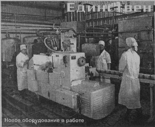
Новое оборудование в работе

В начале этого года на производственных площадях консервного завода в ООО «Облконсервпром» был создан цех по выпуску мягкого масла на растительной основе. С лета цех стал отдельным закрытым акционерным обществом «Петербургский продукт». На днях здесь была запущена в эксплуатацию новая линия немецкой фирмы «Шрёдер», которая позволит довести суточный выпуск масла до 40 тонн и задействовать в производственном процессе порядка 100 человек.