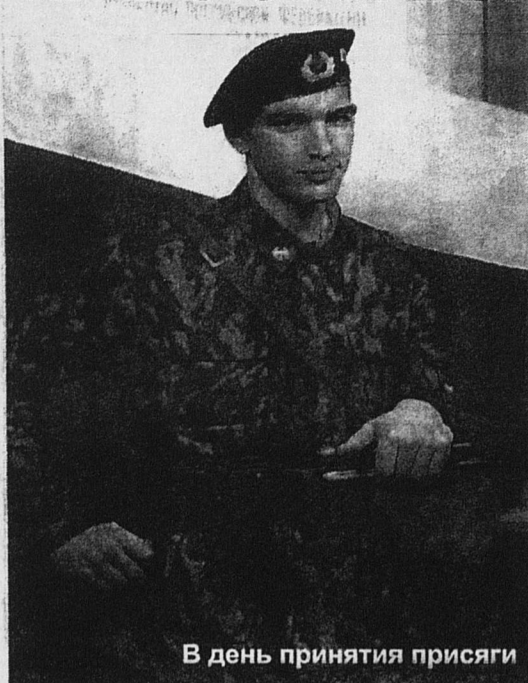
В день принятия присяги