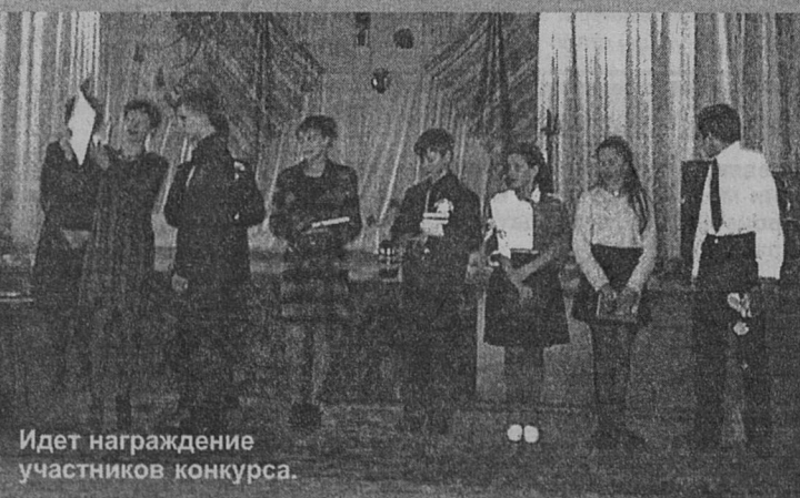
Идет награждение участников конкурса.

Конкурс «Ученик года» уже стал традиционным в нашем районе. Он проходит в несколько этапов и на заключительный тур попадают лучшие из лучших. 23 февраля 6 конкурсантов - учащихся среднего звена - боролись за получение престижного звания.