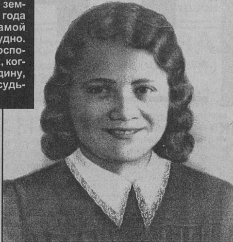
Фото 1941 года.