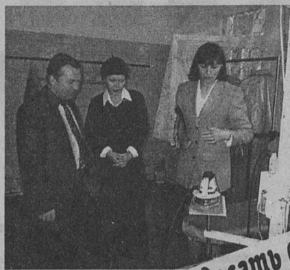
Сланцевским хозяйкам больше не нужно ломать голову над этой проблемой.