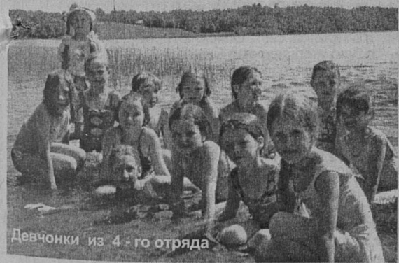
Девчонки из 4-го отряда

ми стали «День самоуправления», «День приколов», «Экономическая игра» и, конечно, поход с ночевкой. День самоуправления - это возможность хотя бы ненадолго побыть в роли взрослых. А в День приколов весь лагерь живет по особым «прикольным» законам. Утро может начаться с дискотеки. Суп на обед, возможно, подадут в стакане. А