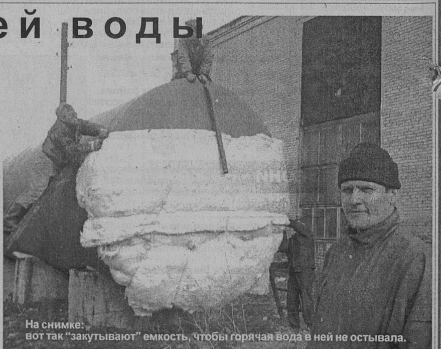
На снимке: вот так “закутывают” емкость, чтобы горячая вода в ней не остывала.