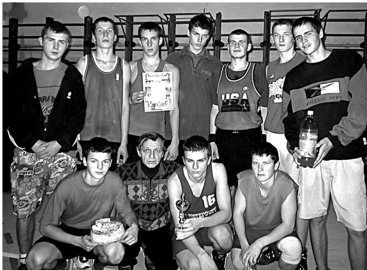
На снимке: баскетбольная команда «Юношество» - чемпионы области, победители первенства города.

Начальник отдела по делам молодежи вручила обоим командам грамоты, торты, а победительнице - переходящий кубок.