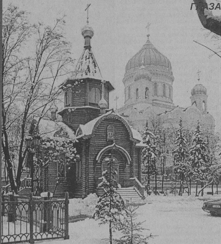
Храм - часовня Державной иконы Божией Матери