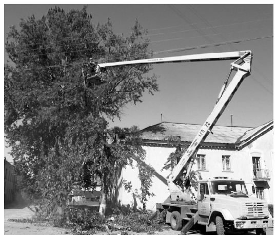
Фото и текст С.ШИШКИНОЙ.

Значит, после окончания строительных и всех прочих работ улицы и дворы должны вновь приобрести цивилизованный вид. Хотя восстановление тротуаров, как признают в администрации, будет довольно сложной проблемой.