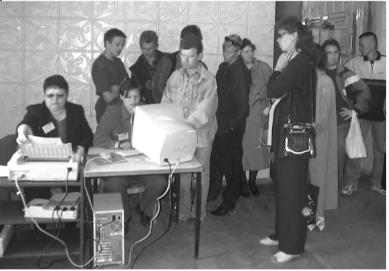
Фото и текст Н.СТЕПАНЕНКО.

Ярмарка - новая форма поиска работы. Ее удобства будут оценены по заслугам.