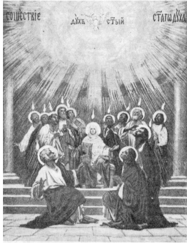
на слушавших его, что многие уверовали в Иисуса Христа. Петр со-

ветовал им покаяться и креститься во имя Иисуса Христа для прощения грехов, чтобы получить дар Святого Духа. Уверовавшие во Христа приняли крещение.