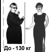
До - 130 кг После - 60 кг

ВНИМАНИЕ!!! 21 и 22 июня с 12.00 до 16.00 в г.Санкт-Петербург по адресу: ул.Спортивная, д.2 (ДЮСШ), телефон 2-32-94, работает консультант МЦ “ВИТА ВАЛИДА”. Записавшимся на лечение в эти дни скидка 5%. Лицензия № 78-030397 от 29.01.2002 г.