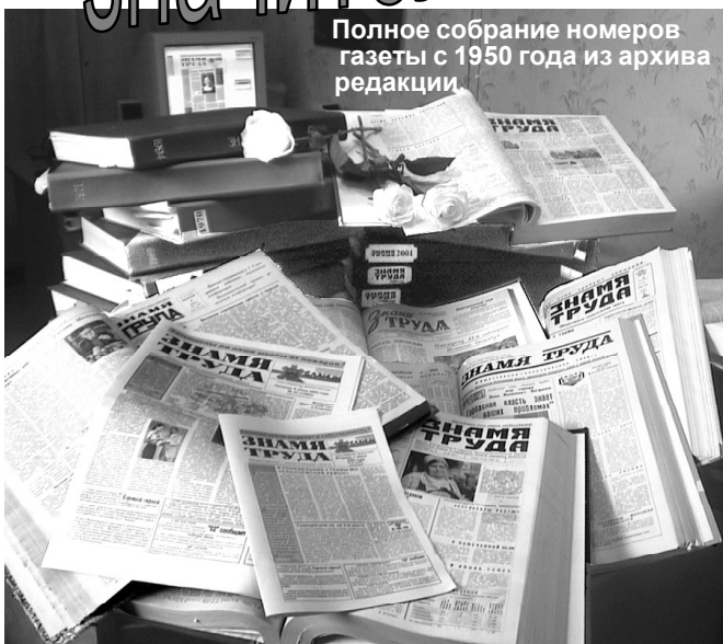
Полное собрание номеров газеты с 1950 года из архива редакции.

году, вскоре после освобождения Сланцевского района от гитлеровских захватчиков. Первые пять номеров газеты печатались в походной типографии, а затем начала действовать Сланцевская типография. Формат