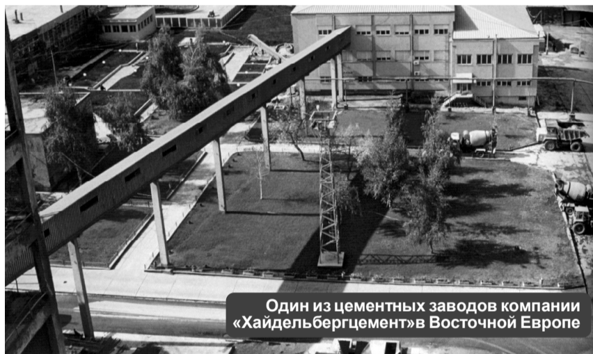
Один из цементных заводов компании «Хайдельбергцемент» в Восточной Европе

приблизительно 3,5 млн. долларов. - Изменилась ли с приходом нового собственника социальная политика «Цеслы»? В «Хайдельбергцементе» не один десяток лет существует корпоративная политика по отношению к собственным кадрам. Это касается как отработанной системы по созданию кадров, обучению безопасной работе, так и этики отношений между работодателем и персоналом, в том числе и по заработной плате. Прочитав все это надо самим зарабатывать, своими руками, в первую очередь своей головой. Не новость, что на Западе не принято платить зарплату, которую человек не заработал. По российским законам, принадлежащим «Хайдельбергцементу», на одного рабочего в год приходится 1200 тонн цемента, а у нас пока даже в этом году не получается 800 тонн. Для примера: на других заводах компании, расположенных в Восточной Европе, на одного рабочего объем выпуска приближается к 3 тыс. тонн.