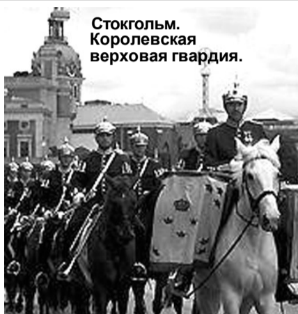
Стокгольм. Королевская верховая гвардия.

Десятки магазинов, бары, рестораны, кафе, дискотеки – всё это «Силья Лайн», на котором одновременно путешествуют три тысячи человек. Никакого строжайшего контроля билетов перед посадкой нет, что в таком пото-