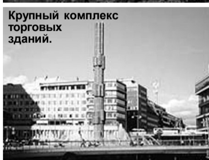
Крупный комплекс торговых зданий.

ской чете все стокгольмские газеты обошла история о том, как короля оштрафовали за превышение скорости. О размерах налогов, отчисляемых королевской четой, известно всем. Между тем, спрашивать соседа о том, как он голосовал на выборах, в Швеции считается верхом неприличия.