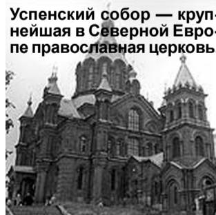
Успенский собор — крупнейшая в Северной Европе православная церковь.