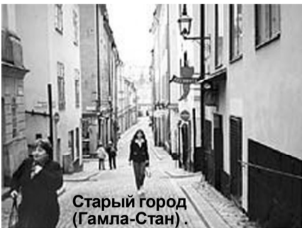
Старый город (Гамла-Стан).

В Стокгольме туристам – раздолье. Можно посвятить время историческим экскурсиям. А дети, да и взрослые, получают массу впечатлений от посещения «Аквариум», где воссоздана природа джунглей и тропиков; необычен и музей «Одного корабля», поднятого со дня моря. Город сказок «Юнибаскет» вызывает особый восторг. Ведь Стокгольм – родина знаменитого Карлсона, а для города Сказок текст экскурсий составляла сама Астрид