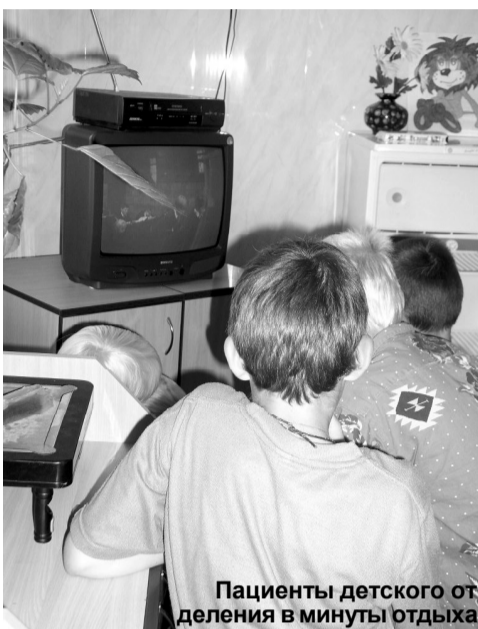
Пациенты детского отделения в минуты отдыха.

- Мы благодарны Правительству области за оказанную помощь. В последний визит областной делегации в наш город был решен вопрос о продолжении ремонта филиала. В августе выделено 900 тыс. руб. На эти средства будут проведены работы по капитальному ремонту неврологического отделения (на снимке слева), пищеблока. В объем войдут работы по замене электрооборудования, оконных блоков, косметическому ремонту помещений, замене