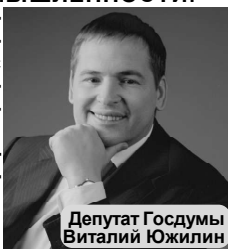
Депутат Госдумы Виталий Южилин

Председатель совета директоров Ассоциации морских портов России, депутат Госдумы Виталий ЮЖИЛИН