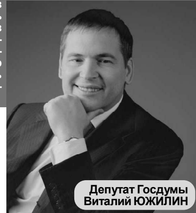
Депутат Госдумы Виталий ЮЖИЛИН

Неожиданный и приятный сюрприз ждал учителей Сланцевского района на традиционном августовском педсовете, прошедшем 28 августа в школе № 12. Теперь в каждой из 14 школ района есть своя библиотека живых голосов поэтов России. А стало это возможно благодаря депутату Государственной Думы Виталию ЮЖИЛИНУ. О том, как родилась такая идея, рассказывает Виталий ЮЖИЛИН: