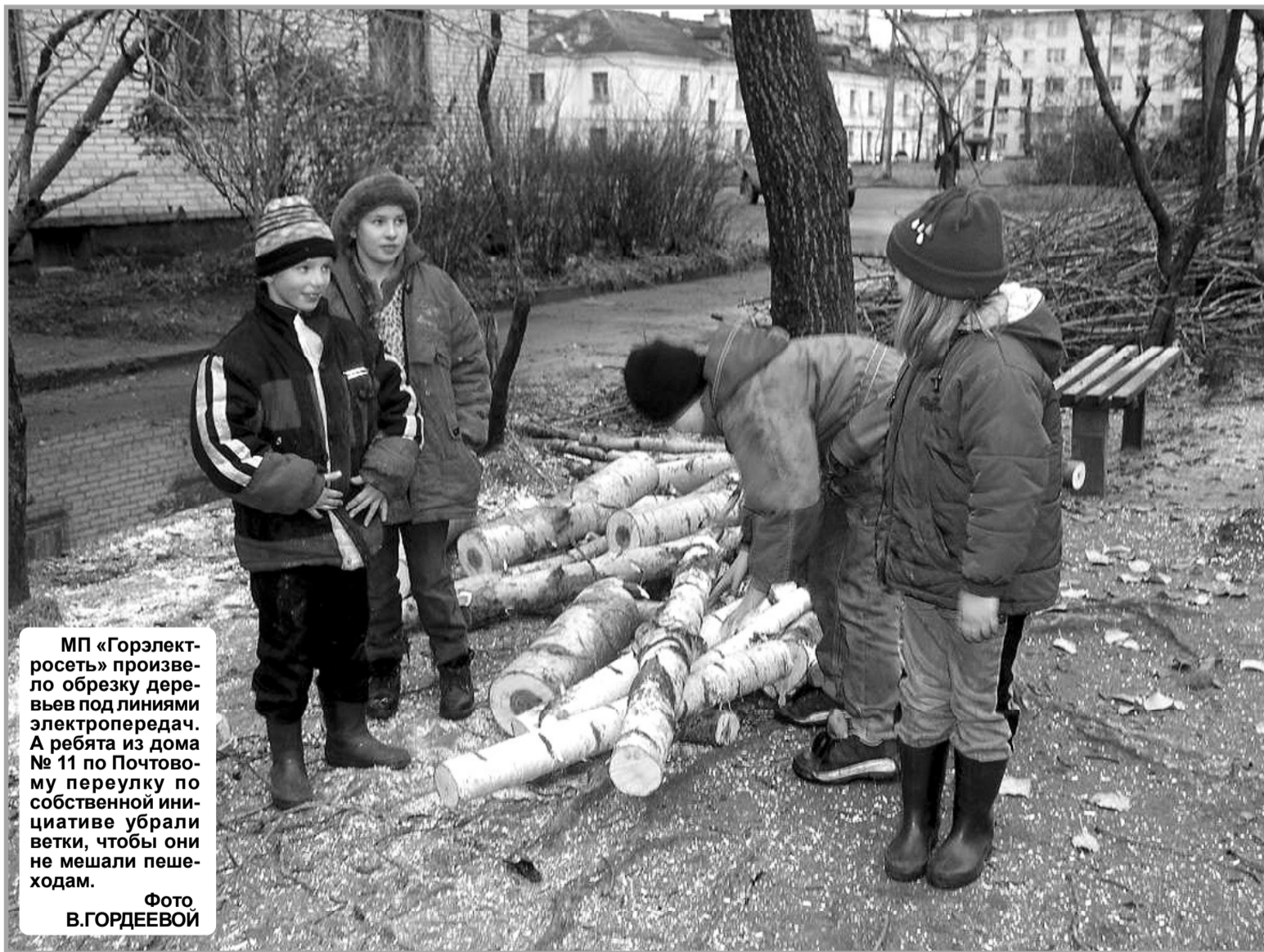
МП «Горэлектросеть» произвело обрезку деревьев под линиями электропередач. А ребята из дома № 11 по Почтовому переулку по собственной инициативе убрали ветки, чтобы они не мешали пешеходам.

А в результате в коллективе комбината благоустройства вновь начались разговоры о проведении протестной акции.