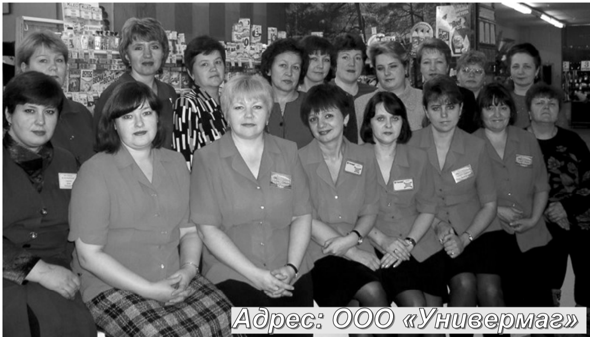
Адрес: ООО «Универмаг»