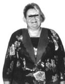
До лечения 112 кг.