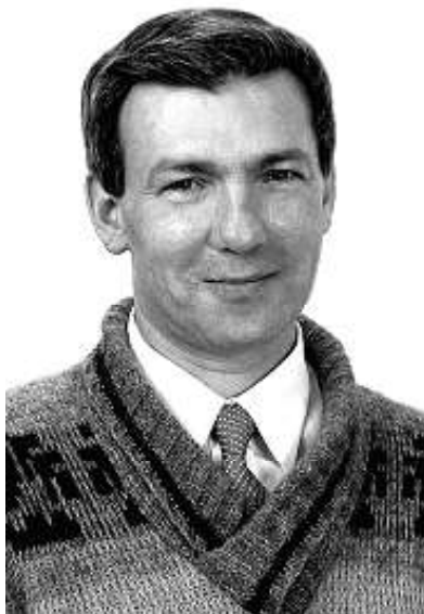
Александр АРГУНОВ кандидат в депутаты Государственной Думы

Мы будем добиваться принятия закона о природной ренте (налоге на использование недр, добычу и переработку полезных ископаемых) и придания этому закону обратного действия до 10 лет. Мы предлагаем провести независимый аудит стоимости предприятий на момент приватизации и взыскать с собственников разницу между фактической стоимостью и уплаченными при приватизации деньгами в бюджет государства. В случае отказа от уплаты разницы в стоимости или задолженности по уплате природной ренты предприятие будет безвозмездно национализировано. Бюджет России увеличится в несколько раз. Полученные средства мы будем направлять на увеличение статей расходов на финансирование образования, медицины, науки и культуры, на повышение заработной платы военнослужащих, обеспечение жильем кадровых военных, перевооружение армии и флота новейшими образцами отечественного вооружения, на развитие предприятий ВПК и разработку новых технологий, на обеспечение финансирования из федерального бюджета льготных категорий граждан. Мы будем направлять средства на поддержку материнства и детства, на увеличение пособий по уходу за ребенком, на увеличение единовременных выплат при рождении ребенка, на организацию бесплатных кружков и секций для школьников, на финансирование школьных столовых и групп продленного дня, на увеличение пенсий за счет федерального бюджета.