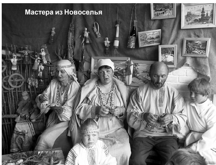
Мастера из Новоселья