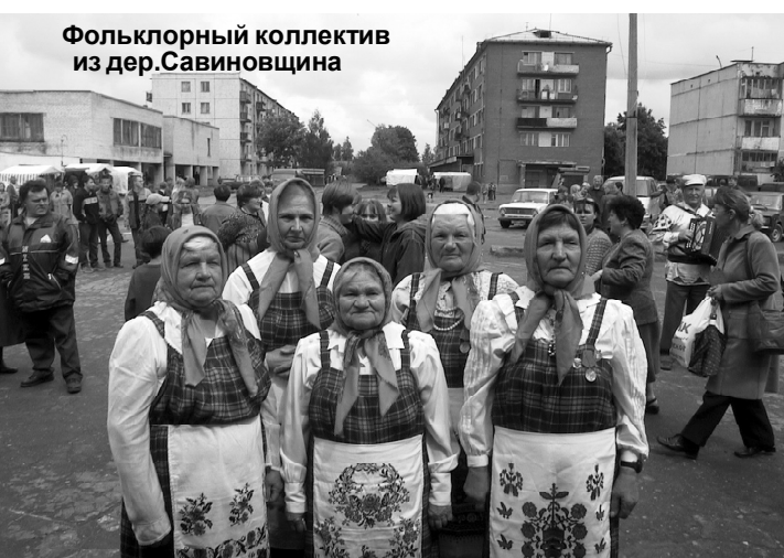
Фольклорный коллектив из дер.Савиновщина