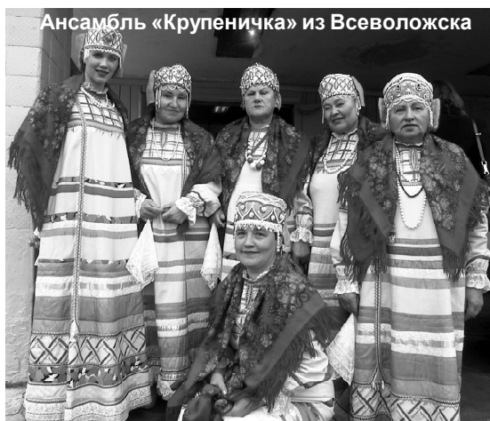
Ансамбль «Крупеничка» из Всеволожска

На снимке сверху: хор русской песни ДК АО «Завод «Сланцы»