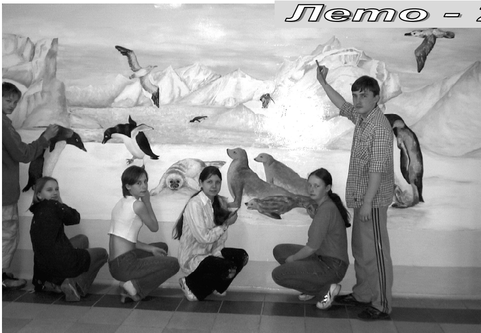
принципы шведской методики воспитания и обучения на природе.

Увы, это пока только фантазии. А в реальности приходится видеть, как порой безжалостно относятся люди к природе, губят ее, захламляют. И потому юные экологи запланировали трудовые десанты, цель которых – наведение чистоты и порядка не только на пришкольной территории, но и походы на северную окраину города. Разработаны три маршрута экологических троп, с которыми ребята пока познакомились теоретически. Но вскоре они пройдут этими маршрутами, сделают немало больших и малых открытий. Самые активные, любознательные экологи поедут