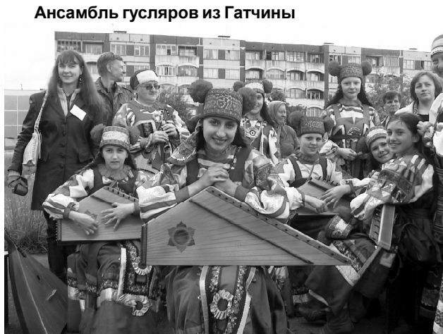
Ансамбль гусяров из Гатчины