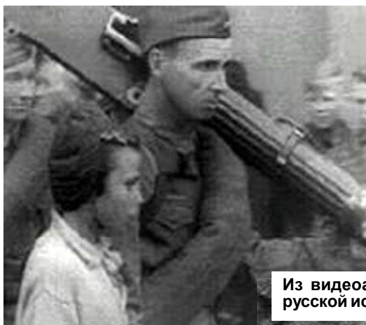
Из видеархива русской истории