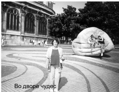
Во дворе чудес

пошла уже в Германии. К поезду готовились, два года изучали язык. Но несмотря на это и помощь родственников (в Германии много лет живут мой первый муж, свекровь, двоюродные