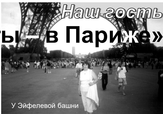
У Эйфелевой башни

– Я жила там три месяца, городок очень красивый, утопает в зелени. Много различных парков, музеев под открытым небом. Не раз ездили и в сосед-