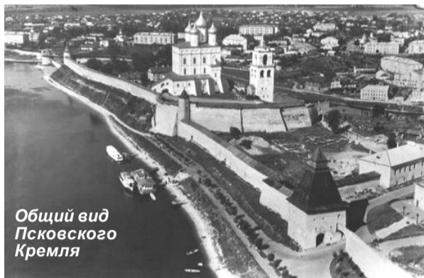
Общий вид Псковского Кремля