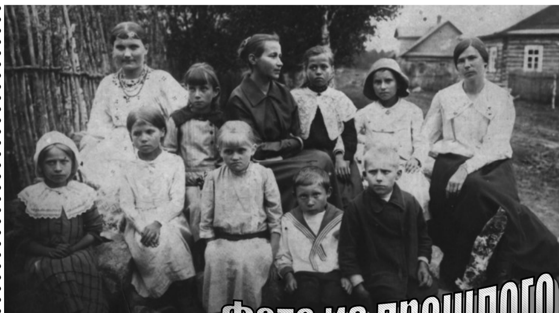
Школа в деревне Дубок

Впереди праздники, и культработники Сланцевского района подготовили для жителей города и села много замечательных праздничных мероприятий. Праздничные концерты пройдут: 8 мая – в 15 часов в Доме культуры деревни Загряжье; 9 мая – в 12 часов в ДК деревни Старополье, в 12 часов – в ДК поселка Черновское, в это же время – в Новосельском Доме русского народного творчества, в 12 часов 30 минут – в ДК деревни Выскатка, в 13 часов – в ДК деревни Овсище.