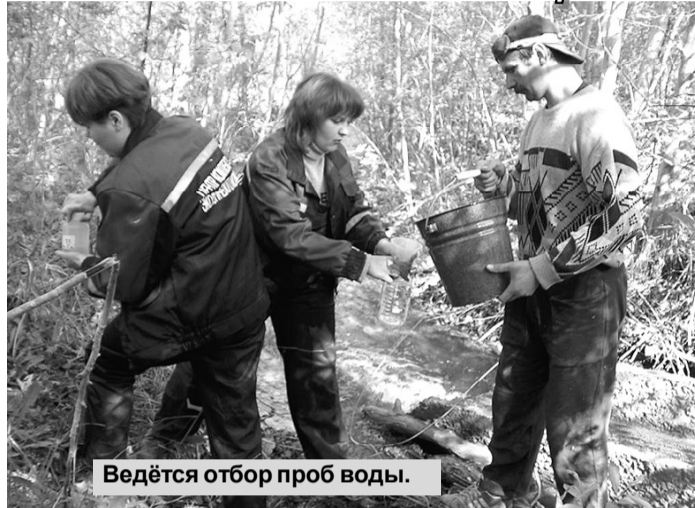
Ведётся отбор проб воды.

фициенты направленного пропускания жидких и твердых прозрачных образцов. Прибор позволяет обрабатывать сразу 10 проб. Полярнограф АВС-1.1 позволяет проводить анализ содержания меди, свинца, кадмия, цинка в водных растворах. Лаборатории уже тесно в нынешних помещениях. В дальнейшем планируется размещение ЦКЭМ на базе АБК шахты имени Кирова после проведения реконструкции. Здесь будут оборудованы лаборатории гидроэкологического мониторинга и мониторинга атмосферного воздуха и почв.