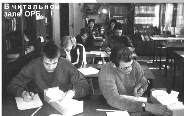
В читальном зале ОРБ

Современный читатель зачастую ищет в книге не откровений. Самое привлекательное для него – лихо закрученный сюжет и обязательно пикантные подробности из жизни героев. Внешнее благополучие, материальные удобства становятся самоцелью и часто отождествляются со счастьем и смыслом жизни. Но еще В.Г.Белинский заметил, что такие книги «время производит... тысячами и пожирает их тысячами». Яркие обложки, кричащие иллюстрации, внешний блеск и яркость. Конечно, чтение – дело сугубо личное. Человек, читающий сегодня классику, поистине изумляет. Как определить те немногие книги – откровения, которые приближают нас к постижению собственного «Я»? Немногие, самые важные книги каждый должен выбрать для себя сам, но рекомендация поможет в поиске настоящей литературы. Именно поэтому литературно-художественное направление многие годы является основным направлением работы отдела обслуживания районной библиотеки. Например, в нынешнем году разработан и уже проводится цикл выставок «Поэт в России – больше, чем поэт», который посвящен жизни и творческому пути М.Цветаевой, А.Ахматовой, Н.Гумилева, Н.Рубцова, С.Есенина и др., цикл книжно-иллюстративных выставок «Юбилей книг», посвященный романам Л.Толстого «Воскресение» и «Война и мир», роману И.Гончарова «Обрыв», трагедии В.Шекспира «Отелло», книжно-иллюстративные выставки «Лучшие книги 20 века», «Все минется, одна правда останется» (деревенская проза), «Чем жив че-