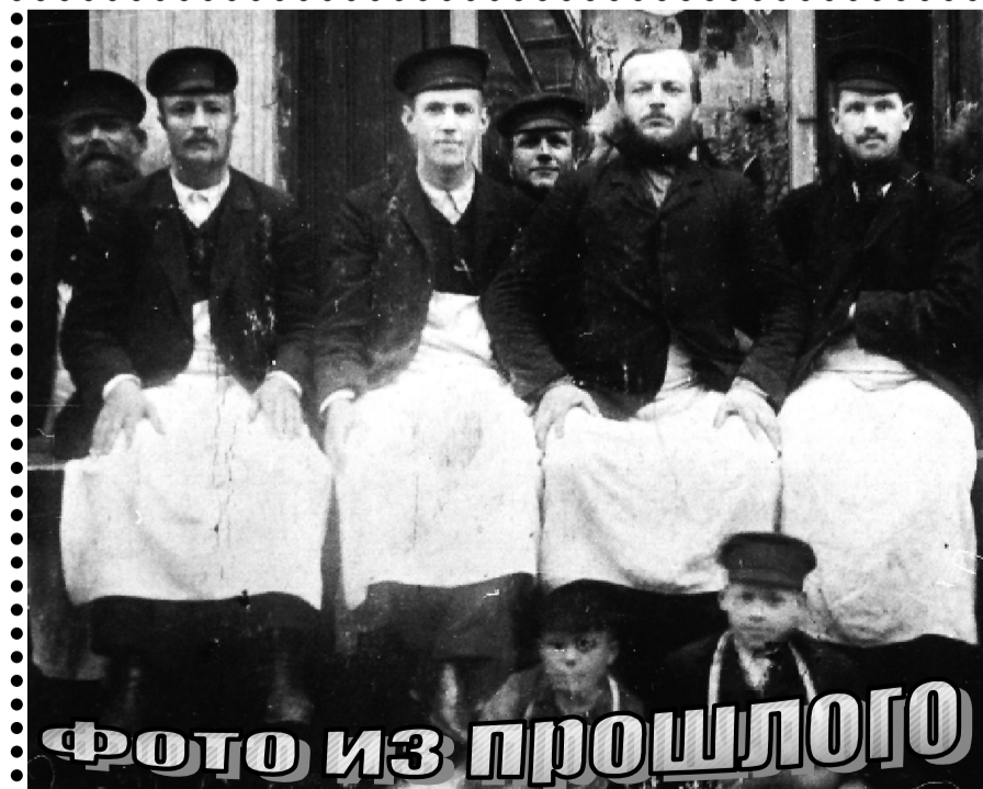
Фото из прошлого Торговцы, д. Ложголово.

На днях маленькие актеры кукольного театра съездили на экскурсию в город Псков и побывали там в гостях в театре, где посмотрели спектакль «По щучьему велению». После этого они встретились с режиссером театра, который рассказал им о своих творческих планах, о том, как проходила работа над спектаклем. После этого актеры театра кукол посетили Мирожский монастырь, на территории которого расположен храм XII века. Там, в музее храма, ребятам разрешили спеть сюжет из спектакля «Рождественские истории». Сегодня актеры готовятся к закрытию театрального сезона, а 30 мая поедут на областной праздник «Детский карнавал» в г. Сосновый Бор. Они примут участие в сказочном шествии и покажут спектакль «Аленушка и гусенок».