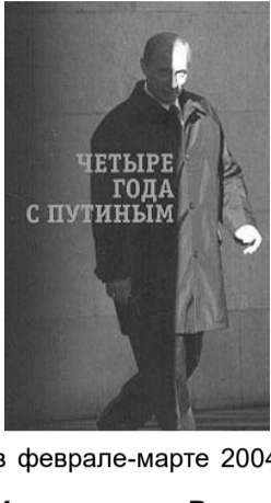
2004 г. Издательство: Время.

Что успел сделать Владимир Путин за первые четыре года президентства, помимо построения "вертикали власти"? Как продвинулись реформы, начатые в 2000 году? Как реагировали на них общество и бизнес?