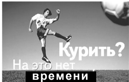
Курить? На это нет времени

Первый раз я попробовала курить в 5-м классе. У нас дома были гости, они шумели, выпивали, курили.