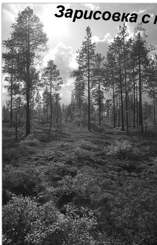
Зарисовка с натуры