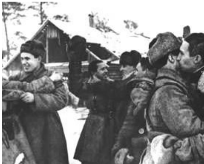
Встреча войск Ленинградского и Волховского фронтов в рабочем посёлке №1.

Использованы выдержки из стихотворений Ольги Берггольц, снимки архивной фотохроники тех лет, а также из Большой советской энциклопедии.