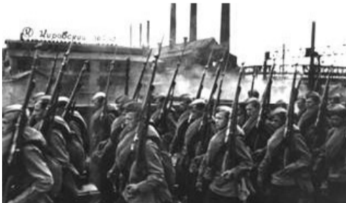
Бойцы народного ополчения направляются мимо Кировского завода на фронт.