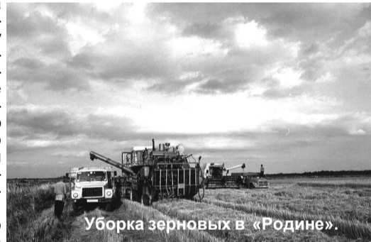
Уборка зерновых в «Родине».

А когда на место прибыла милиция, выяснилось, что только что в ОВД поступило телефонное сообщение об ... угоне того самого «Москвича». Владелец явно хочет доказать свою непричастность к краже картофеля. Сейчас по этому делу ведется проверка.