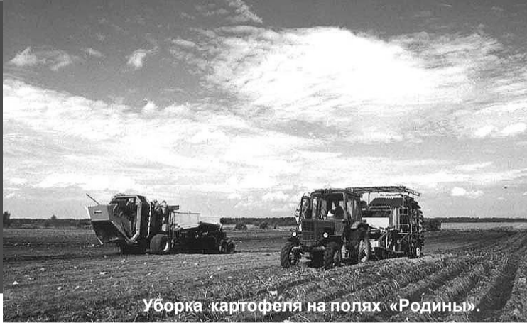
Уборка картофеля на полях «Родины».

рачивается настоящий детектив. Недавно был замечен на одном из картофельных полей «Москвич» без регистрационного номера. Человека, который на нем приехал и уже успел накопать мешок картошки, задержать не успели, он убежал.