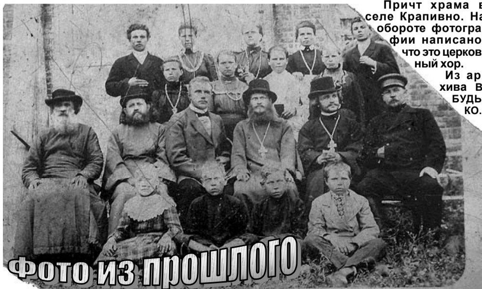
Фото из прошлого

По окончании церемонии награждения педагоги получили прекрасный подарок – они посмотрели оперу «Иоланта».