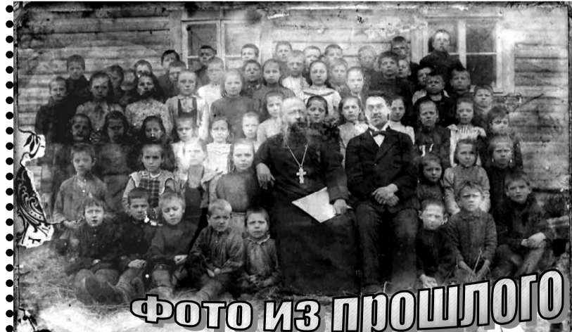
ФОТО ИЗ ПРОШЛОГО