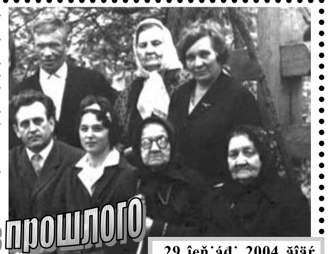
ФОТО ИЗ ПРОШЛОГО