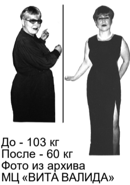
До - 103 кг После - 60 кг

15 лет врачи МЦ «ВИТА ВАЛИДА» избавляют от лишнего веса, алкогольной зависимости с помощью АКУПУНКТУРНОГО ПРОГРАММИРОВАНИЯ (АП). АП – метод врача-психотерапевта, нарколога С.П. Семёнова (патенты: № 2092193; № 2092192; № 2089230; № 2099096; № 2094040). Метод АП позволяет за один лечебный сеанс: ✓ в случае ожирения НОРМАЛИЗОВАТЬ ОБМЕН ВЕЩЕСТВ, переключив организм из режима накопления жира в режим сжигания лишней жировой ткани, и тем самым запустить процесс ЕСТЕСТВЕННОГО ПОХУДЕНИЯ; ✓ в случае злоупотребления алкоголем максимально мобилизовать нервно-психический резерв пьющего и сделать его СПОСОБНЫМ НЕ ПИТЬ спиртное в любой компании и ситуации. ВНИМАНИЕ!!! В г.Сланцы работает регистратура МЦ «ВИТА ВАЛИДА» по адресу: ул. Спортивная, 2 (ДЮСШ). Тел. 2-32-94; Пн, Ср, Пт с 16.00 до 20.00, Сб с 11.00 до 15.00. Адрес в Санкт-Петербурге: ул. Казначейская, д.6/13; м. «Садовая»/«Сенная площадь». Тел.: (812) 315-26-20. Ежедневно с 10.00 до 19.00. Стоимость проезда в С.-Петербург и обратно включена в стоимость сеанса.